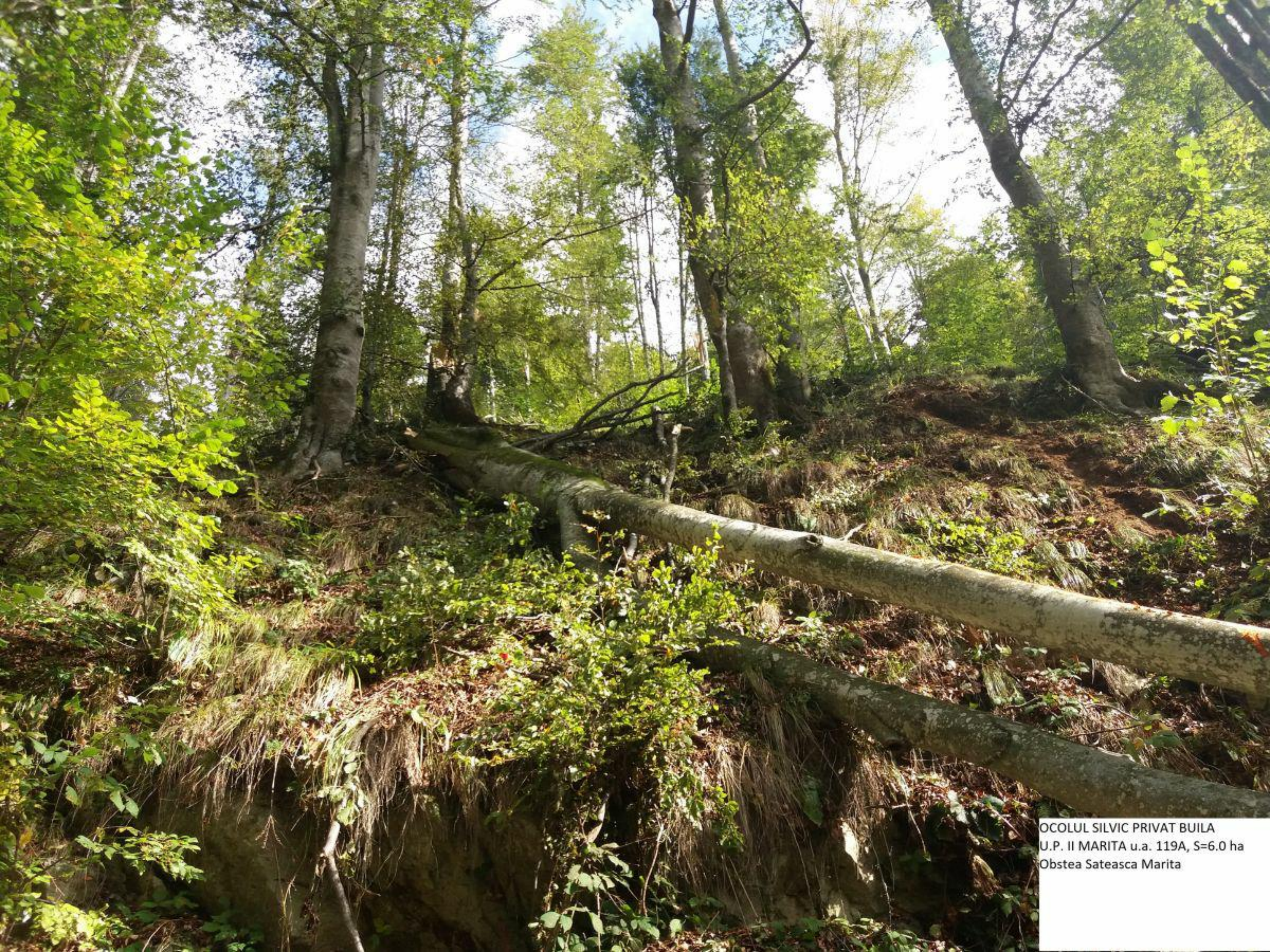
OCOLUL SILVIC PRIVAT BUILA U.P. II MARITA u.a. 119A, S=6.0 ha Obstea Sateasca Marita