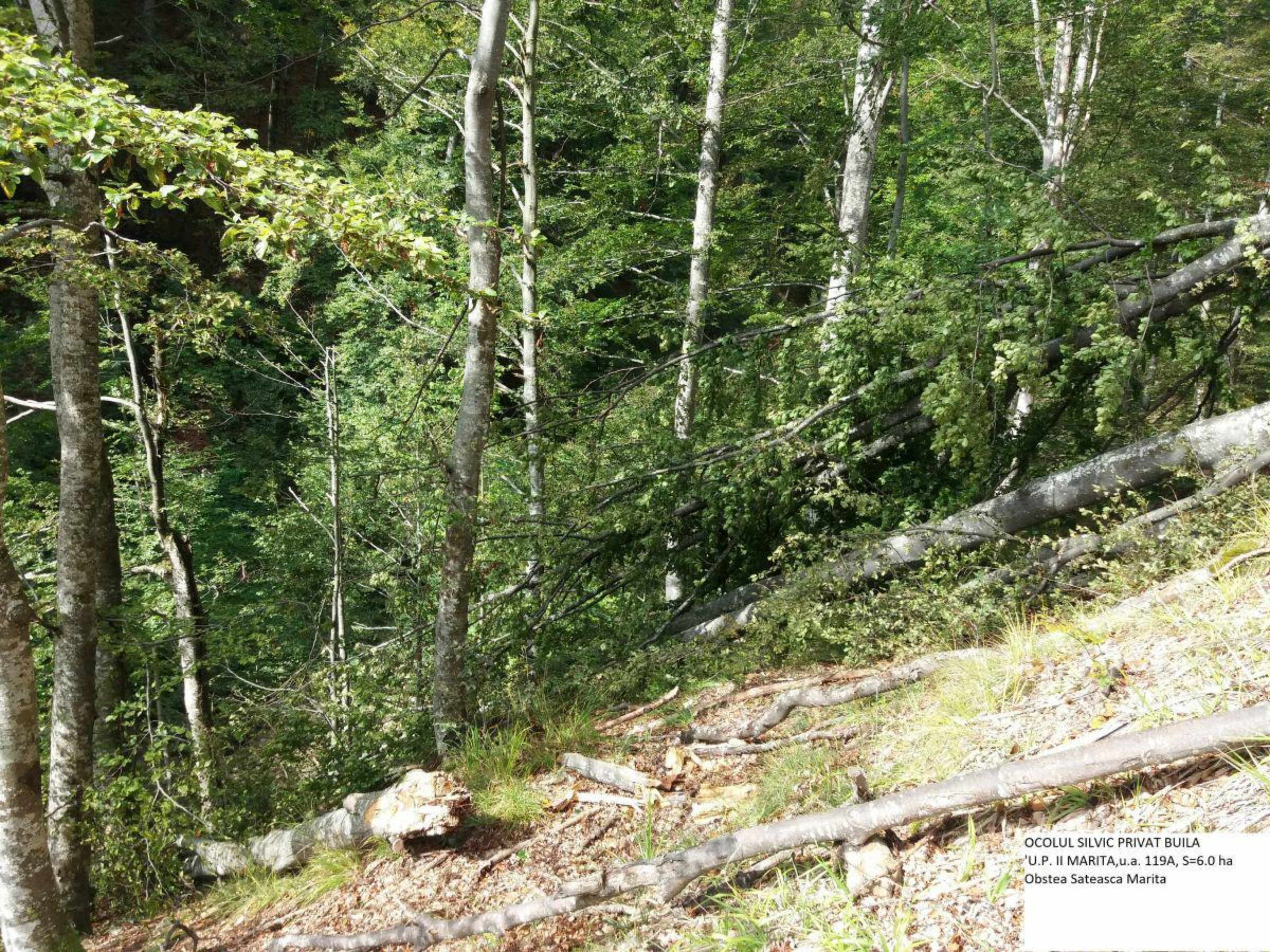
OCOLUL SILVIC PRIVAT BUILA 'U.P. II MARITA, u.a. 119A, S=6.0 ha Obstea Sateasca Marita