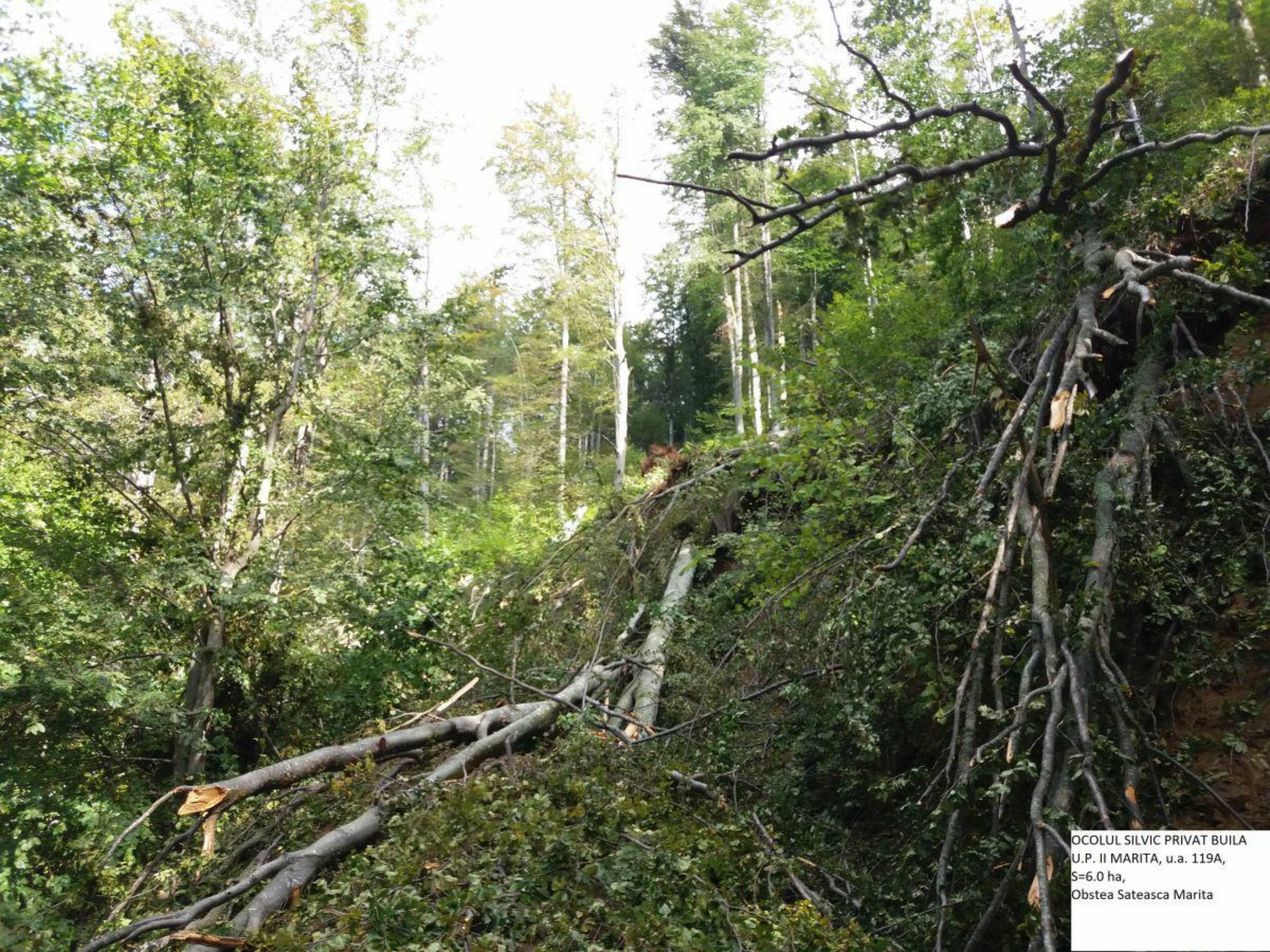
OCOLUL SILVIC PRIVAT BUILA U.P. II MARITA, u.a. 119A, S=6.0 ha, Obstea Sateasca Marita